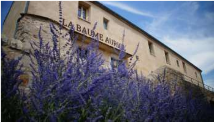
Le belvédère de la Baume Auriol (Hérault)