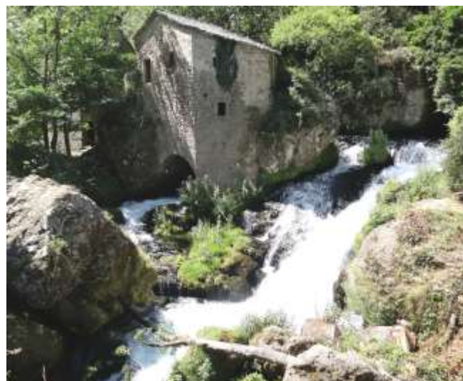
Les moulins de la Foux

La mise en œuvre de la seconde phase de l'Opération Grand Site en 2012 permet