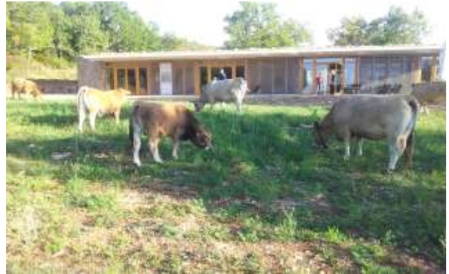
Les belvédères de Blandas (Gard)

250 000 visiteurs annuels profitent des vues très impressionnantes du Cirque de Navacelles depuis les belvédères de la Baume Auriol et de Blandas, et des éléments patrimoniaux remarquables sur les causses.