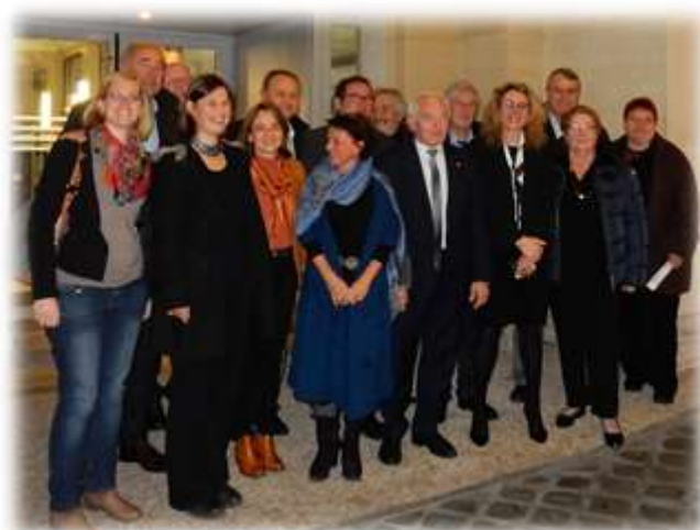
Une équipe soudée ! Délégation présente à la commission Supérieure des Sites le 16 décembre 2016

3- Contribuer activement à faire reconnaître la valeur patrimoniale des paysages agropastoraux au sein du Bien Causses & Cévennes, inscrit sur la liste du patrimoine mondial de l'humanité de l'UNESCO.