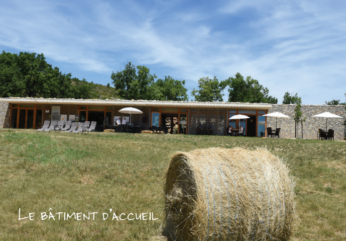
LE BÂTIMENT D'ACCUEIL