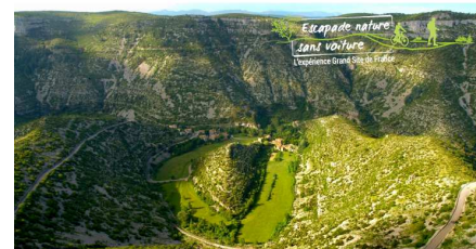
Grand Site du Cirque de Navacelles

Une escapade testée et validée 100% sans voiture depuis Paris dans le Grand Site du Cirque de Navacelles