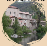
LE MUSÉE CÉVENOL