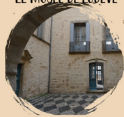
LE MUSÉE DE LODÈVE