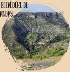
LE BELVÈDÈRE DE BLANDAS