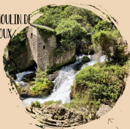
LE MOULIN DE LA FOUX